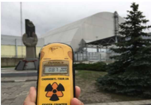
カマボコシェルターに入った4号炉。周辺線量は意外と低い。

そんなようなことをもつと質問したり議論したりしたかったが、私の貧相な英語力ではそこまで行き着かず、ちよっぴり悲しい思いをしながら原発を後にした。(つづく)